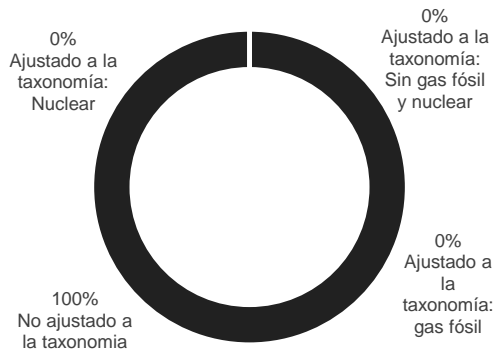
1. Ajuste a la taxonomía, de las inversiones incluidos los bonos soberanos*